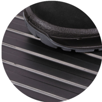
G1303 Leistenmatte schwarz