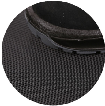
G1300 Feinriefenmatte schwarz